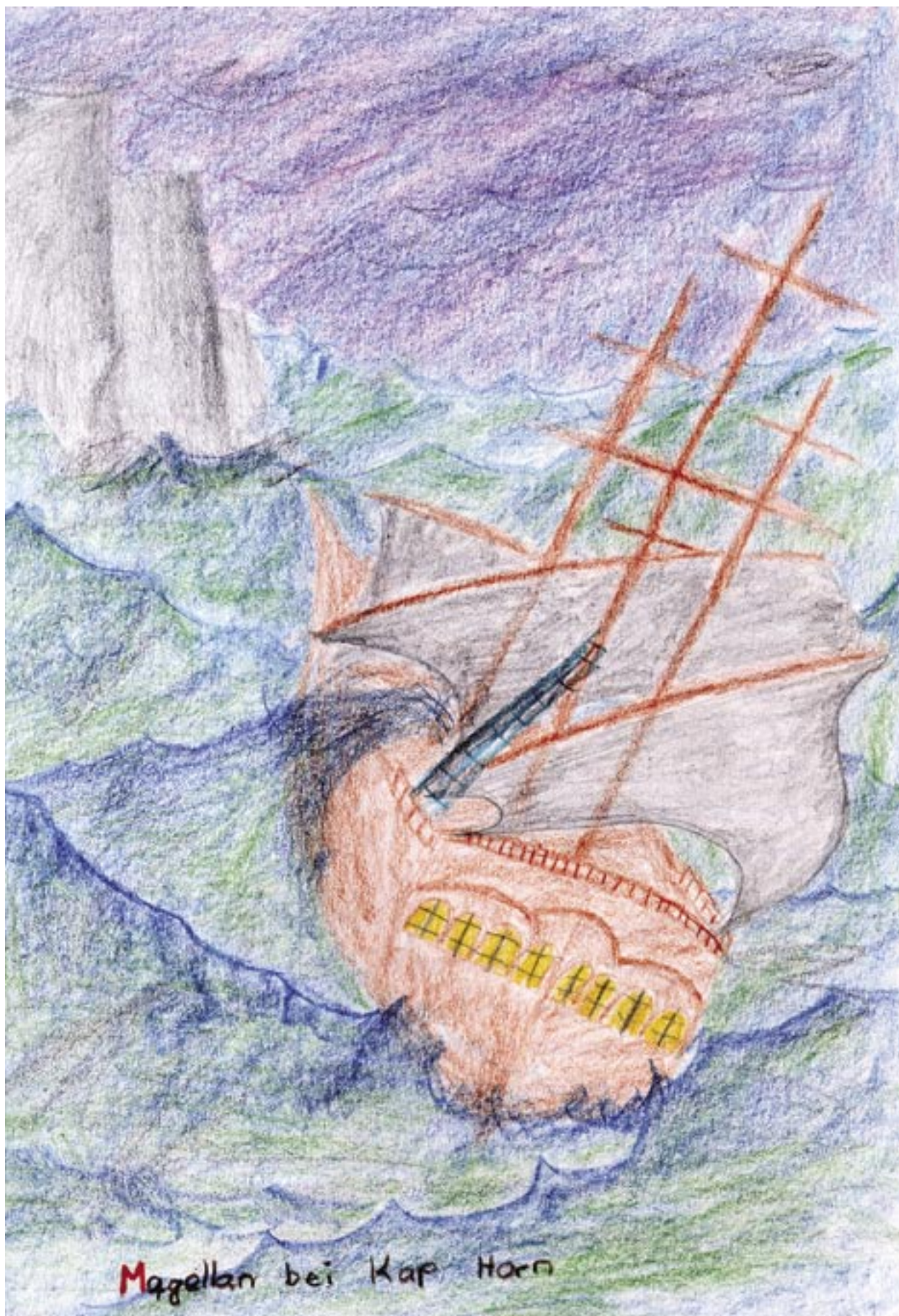
Magellan bei Kap Horn