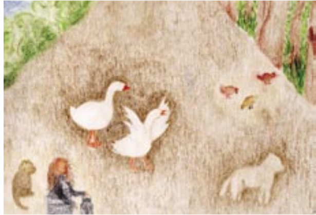
oben: Der stolze Ganter verteidigt sein Revier.

Der Regen nahm zu und gewaltiger Donner rollte durchs Tal - was würde der nächste Tag bringen?