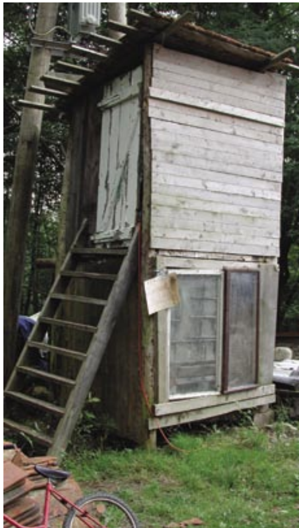
unten: Das Kompostklo der Stöckenmühle war die Hölle. Keiner wollte freiwillig dort hineingehen. Nicht einmal die Bewohner der Stöckenmühle!